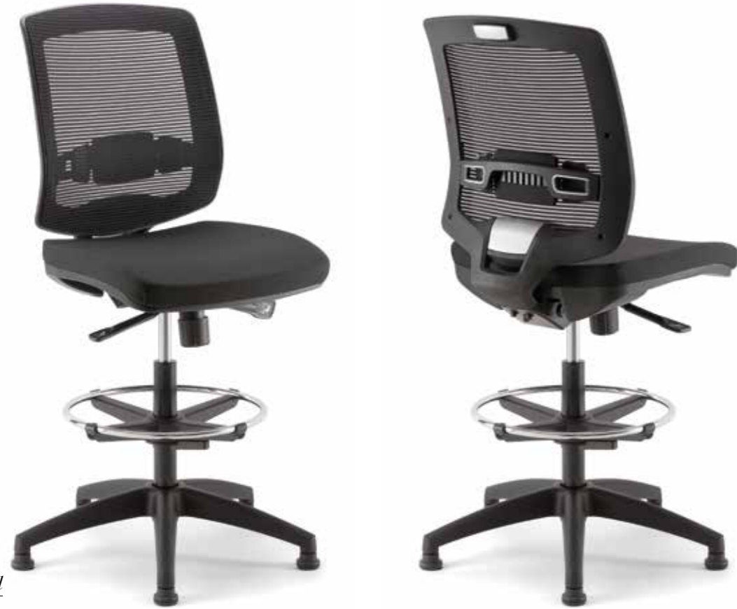
New Malice Stool 01/