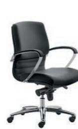
Digital Chrome 02/