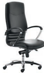
Digital Chrome 01/