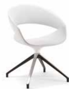
02 FLC spot