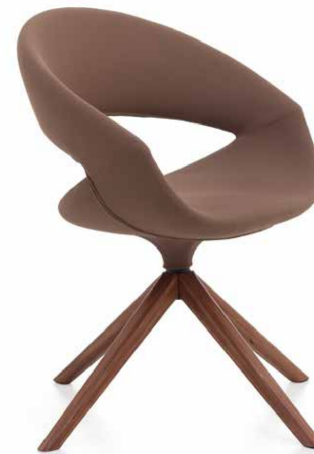
02 FWD spotsoft