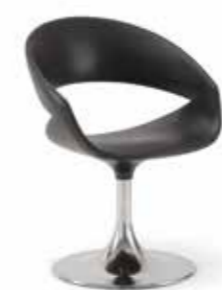
01 BTC spot