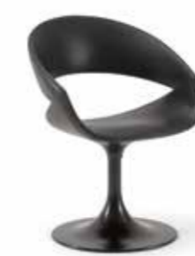
01 BTB spot