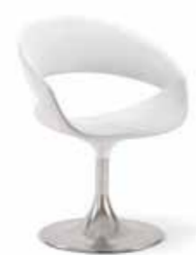
01 BTC spot

Un siège en forme de coupe qui combine siège et dossier à travers une structure continue et enveloppante en deux couleurs. Idéale pour l'attente ou pour les salles de réunion, parfaite pour une décoration moderne et sophistiquée.