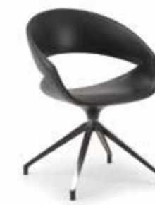
02 FLC spot