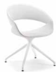
02 FLW spot