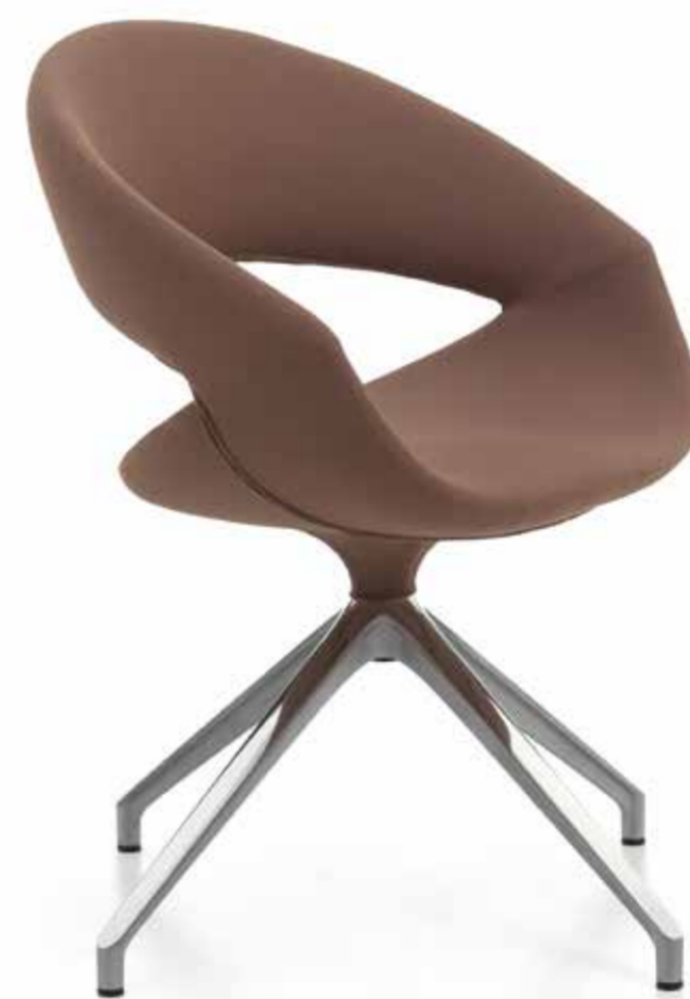
02 FLC spotsoft

La base devient un élément qui caractérise la chaise. Élément de rupture ou de grande continuité avec l'environnement. Bases en aluminium, en acier ou en bois, sélectionnées pour satisfaire exigences fonctionnelles ou esthétiques différentes. La forme de la chaise ne change pas, à travers les bases, cependant, l'effet esthétique dans son ensemble change complètement. Pas seulement un simple accessoire mais un élément essentiel de la personnalisation.